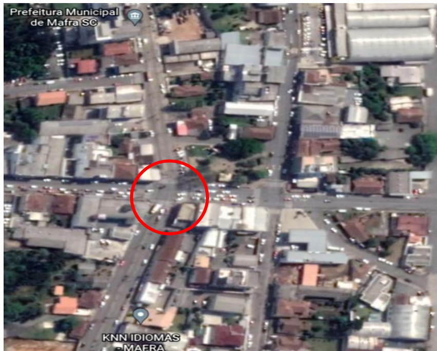
(Rua Tenente Ary Rauen x Av. Pref. Frederico Heyse)

O objetivo é a contratação de empresa de consultoria em engenharia de tráfego para elaboração de estudos, serviços técnicos especializados, projetos conceituais e básicos para melhoria das condições de fluidez e de segurança viária em 02 (dois) pontos críticos nas áreas abaixo representadas do Município de Mafra – SC