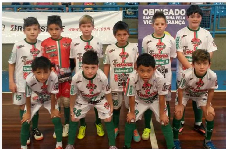
Campeonato em Joinville

O Mafra Futsal base vem ininterruptamente desde 2013 realizando seu projeto de excelência no futsal. Os atletas participam de amistosos com equipes de Monte Castelo, São Bento do Sul, Rio Negrinho, Canoinhas e times locais. Ainda, a seleção de algumas categorias participa de campeonatos estaduais e regionais.