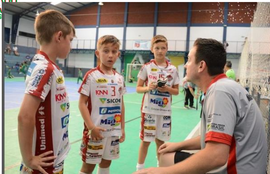
Momento da final da quarta etapa da V Copa Norte em 2019

Em 2020, mesmo com a pandemia do do novo coronavírus (Covid-19), o Mafra Futsal se adaptou e produziu conteúdo online para seus alunos. As atividades aconteciam online, três vezes por semana.