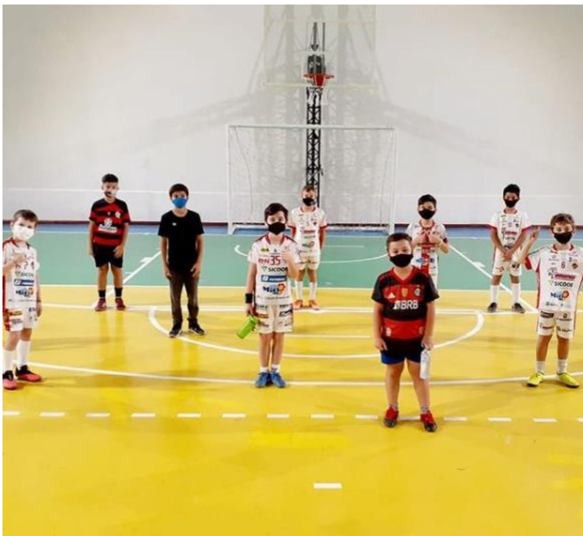
Crianças em dia de treino mantendo distanciamento social devido a pandemia da COVID-19

Logo após, a liberação dos esportes pela vigilância sanitária, o Mafra Futsal retomou suas atividades presenciais, mantendo todos os critérios distanciamento social. O projeto cumpriu seu papel em um momento tão importante, onde crianças e jovens reduziram a prática de atividade física devido a pandemia da COVID-19 e o esporte é fundamental para o desenvolvimento cognitivo e físico.