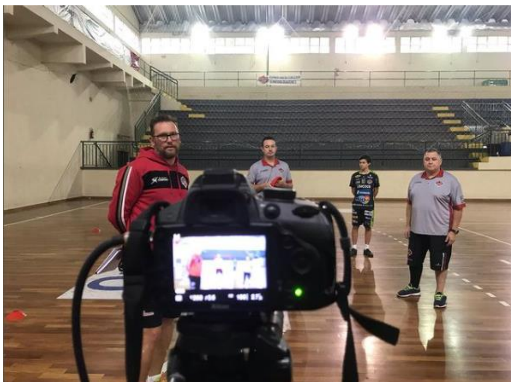
Bastidores da gravação das aulas online

Em 2020, mesmo com a pandemia do do novo coronavírus (Covid-19), o Mafra Futsal se adaptou e produziu conteúdo online para seus alunos. As atividades aconteciam online, três vezes por semana.