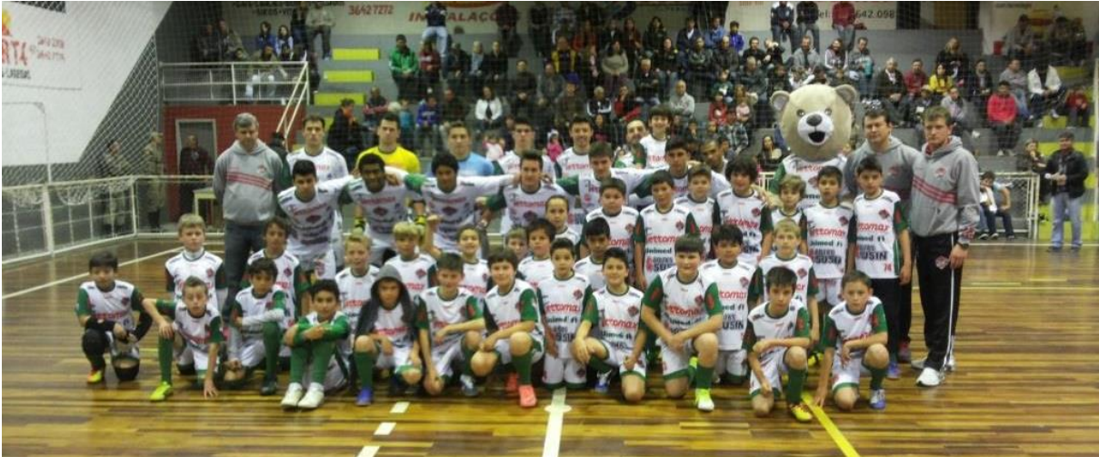
Mafra Futsal com a categoria de base 2013.