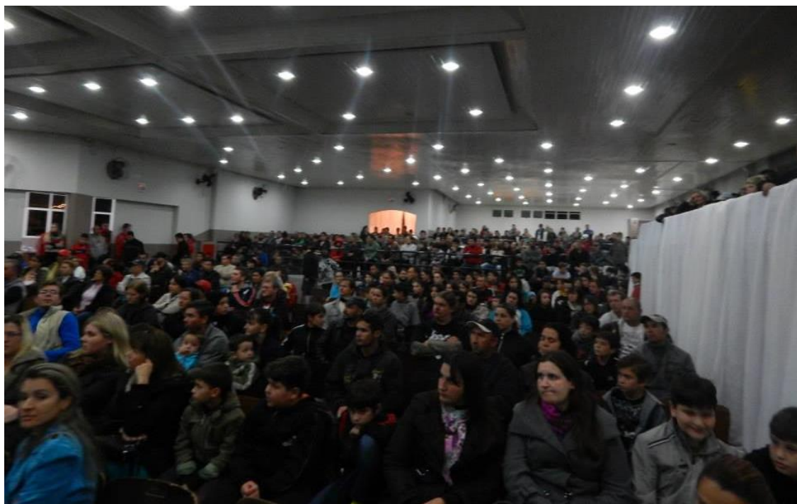
Lançamento da temporada 2014 das escolinhas do Mafra Futsal

O lançamento em 2014, ocorrido no Landom Club, com a palestra sobre Combate ao Uso de Drogas teve um público de 900 pessoas entre pais e atletas