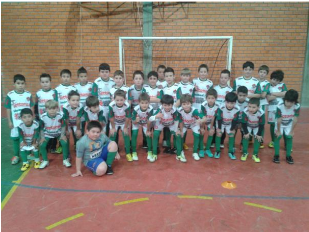
Categoria de base sub 09 em 2013.