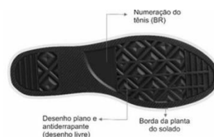
Vista externa (Foto Ilustrativa)