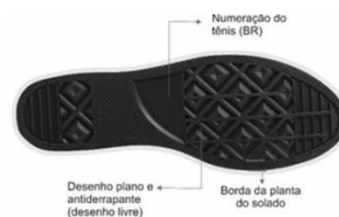
Vista externa (Foto Ilustrativa)