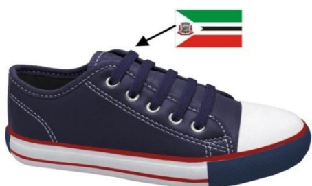
Vista externa (Foto Ilustrativa)

k) Sola - Peça integrante da base inferior do calçado. Deverá ser fabricado em borracha de butadieno estireno (SBR) vulcanizada. Este solado deve ser na cor preta, devendo ter a gravação da numeração em todos os tamanhos de forma permanente, e formato antiderrapante, similar a ilustração abaixo. E na sua base deve acompanhar o perfil da forma e ser em formato de cunha.