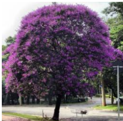
Figura 6 - Quaresmeira ( Tibouchina Granulosa )