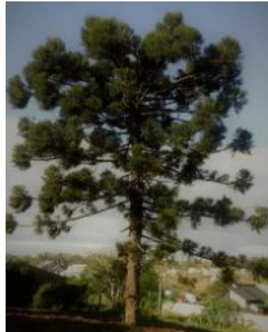
Figura 7 - Pinheiro (Araucária Angustifólia)