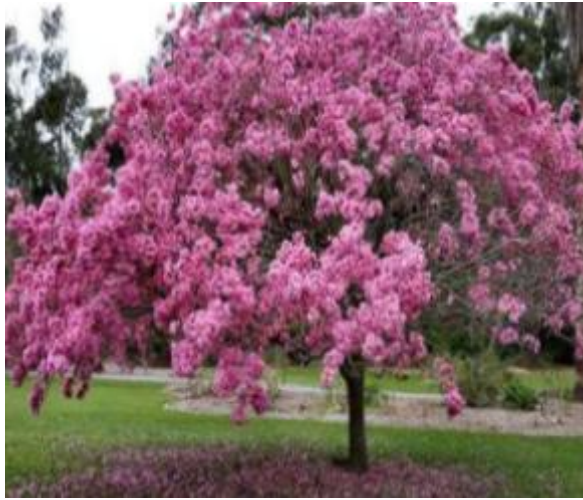
Figura 4 - Ipê Rosa ( Handroanthus Heptaphyllus )