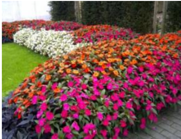
Figura 11 - SunPatiens ( Impatiens Hybrida )

A espécie para a forração, será da espécie SUNPATIENS ( Impatiens hybrida ) nas cores laranja, rosa e branco e deverão ser plantadas no local indicado do projeto.