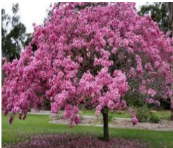
Figura 4 - Ipê Rosa ( Handroanthus Heptaphyllus )