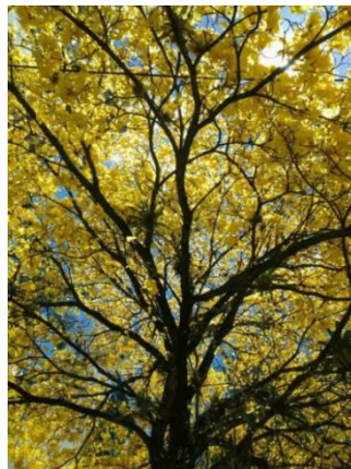
Figura 3 - Ipê Amarelo ( Handroanthus Albus )