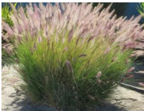
Figura 9 - Capim do Texas Verde ( Pennisetum setaceum )