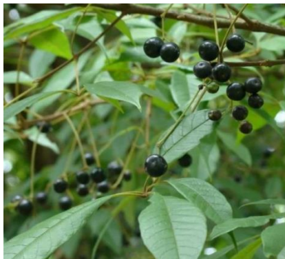
Figura 2 - Folha Árvore Tarumã ( Vitex Montevidensis )