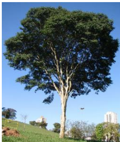
Figura 5 - Pau Ferro ( Caesalpinia leiostachya )