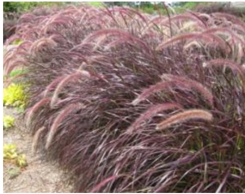
Figura 10 - Capim Texas Rubro ( Pennisetum Setaceum Rubrum )