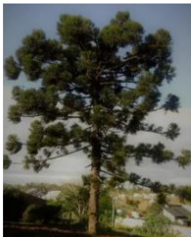
Figura 7 - Pinheiro ( Araucária Angustifólia )