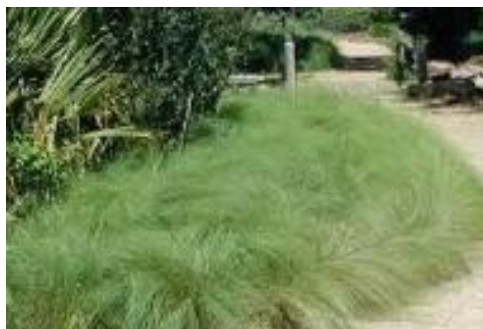
Figura 8 - Capim Chorão ( Eragrostis Curvula )