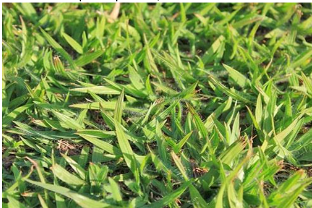
Figura 11 - Grama batatais.

O Plantio de grama-batatais deverá ser feito após a retirada entulhos e pedras do solo. O solo deve ser revolvido antes da colocação das placas de grama. As placas colocadas juntas e apertadas no solo. Regar a grama abundantemente após o plantio, evitando-se fazer isso sob sol direto.