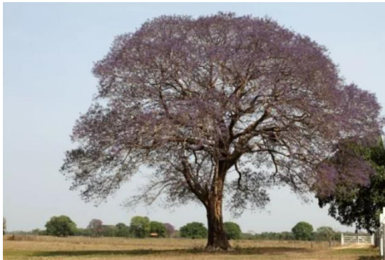
Figura 1 - Tarumã ( Vitex Montevidensis )