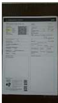
CRLV (2).jpeg 105K