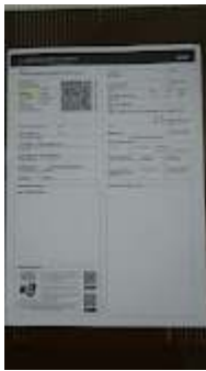
CRLV (1).jpeg 111K