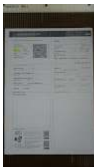
CRLV (3).jpeg 111K