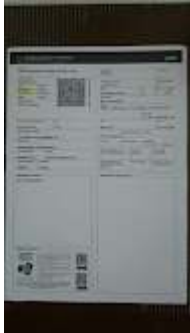
CRLV (2).jpeg 105K

Vendas 1 | AMD SEGUROS <vendas1@amdseguros.com.br> Para: "sme.mafra@gmail.com" <sme.mafra@gmail.com>