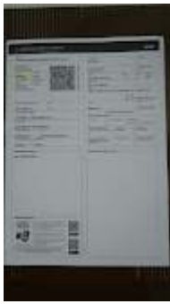
CRLV (1).jpeg 111K